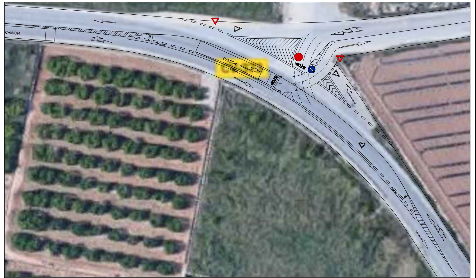
CONEXIÓN DE LA CV-373 CON EL CAMINO VIEJO DE VILLAMARCHANTE